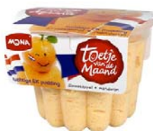
Mona Luchtig EK toetje

Mona introduceert iedere maand een nieuw toetje. Zo was er tijdens het EK het 'Luchtig EK Toetje' en in augustus het 'Olympisch toetje'.