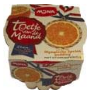
Mona Olympisch toetje