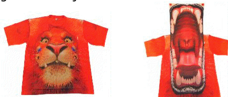
Europese Modelregistratie Brul shirt Designs 900857-1

Leeuwen en de kleur oranje zijn symbolen die vrijwel iedereen associeert met Nederlandse sporters. Elementen die vrij te gebruiken zijn door iedereen.